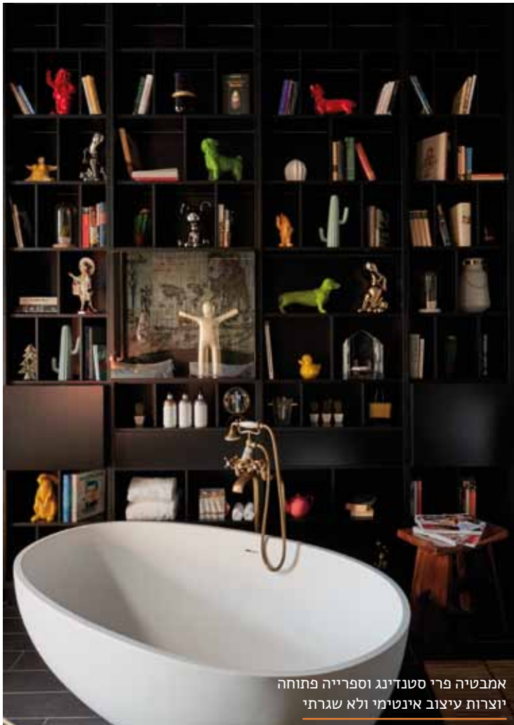
אמבטיה פרי סטנדינג וספרייה פתוחה יוצרות עיצוב אינטימי ולא שגרת