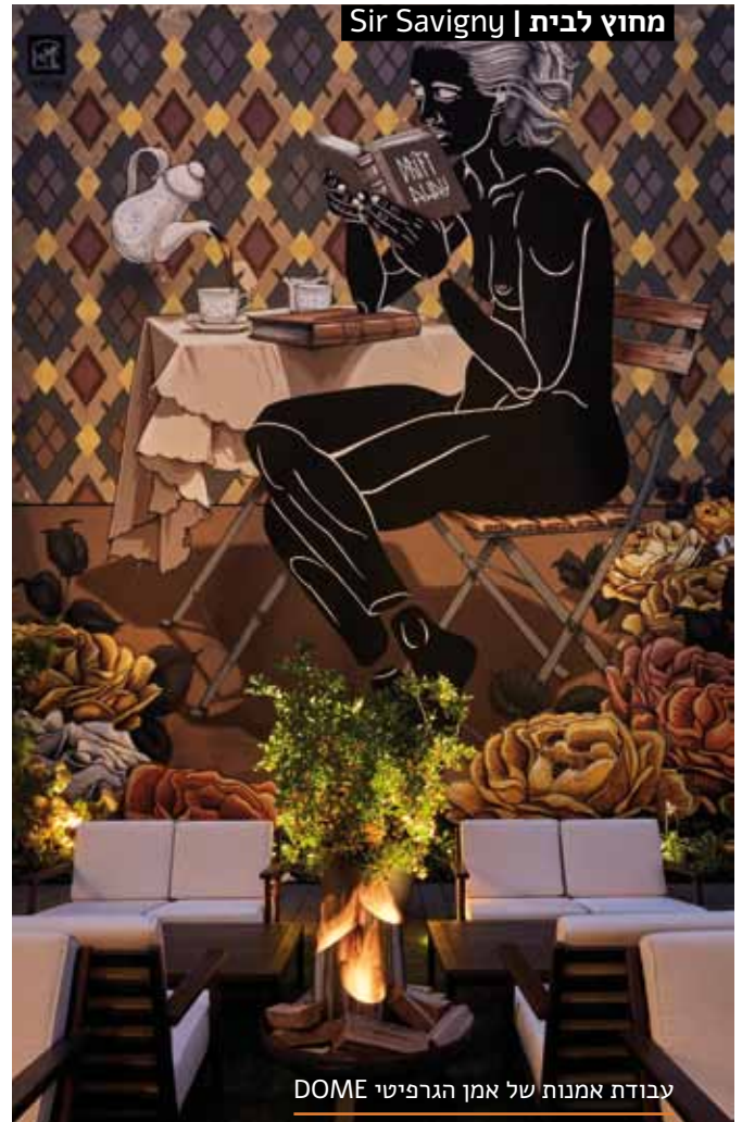
מחוץ לבית | Sir Savigny