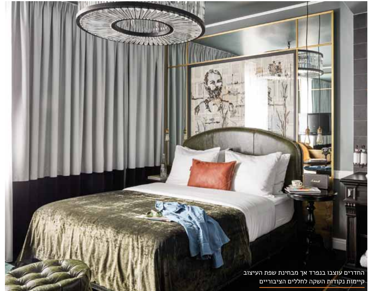
החדרים עוצבו בנפרד אך מבחינת שפת העיצוב קיימות נקודות השקה לחללים הציבוריים

המיקום מרכזי, העיצוב ישראלי וההמבורגר יגיע אליכם עד למיטה. המלון בברלין שמציע את הטוב מכל העולמות | שרון בן דוד צילום Steve Herud, צילום חללים ציבוריים באדיבות מלון Sir Savigny