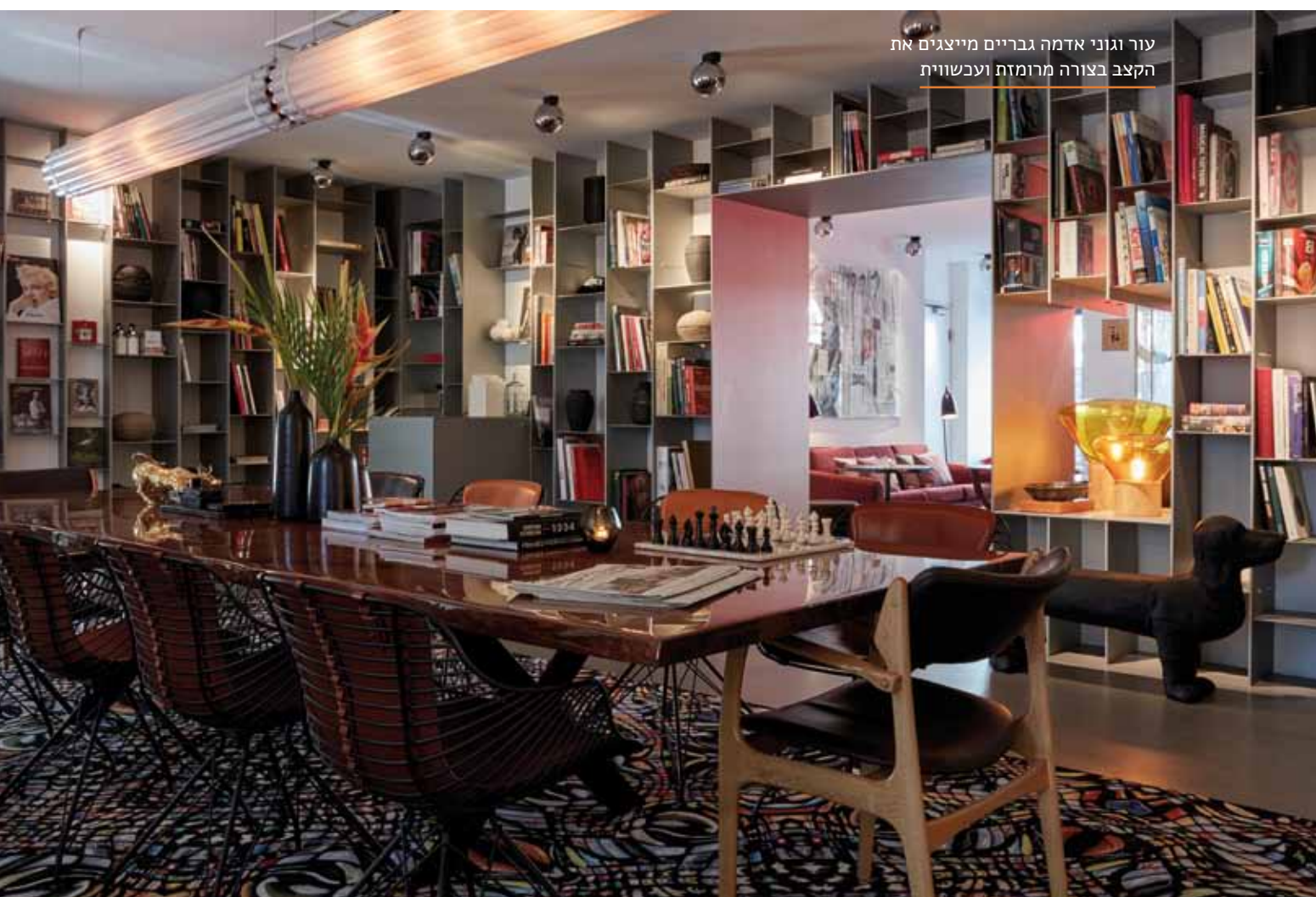
עור וגוני אדמה גבריים מייצגים את הקצב בצורה מרומזת ועכשווית